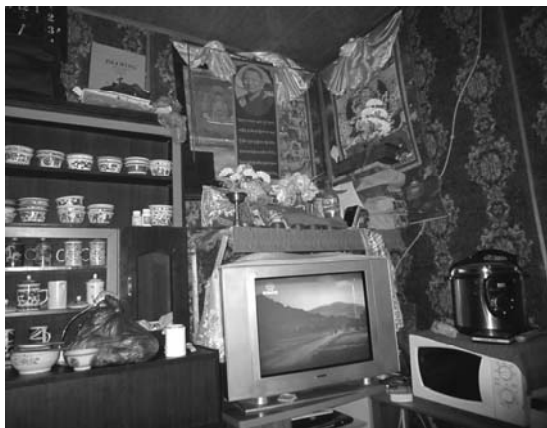
テレビの上の仏壇（四川省）

には仏間や仏壇があり、ご当地の活佛（高僧の生まれ変わり）の写真、造花や経典を供え、特に清潔にしていた。ある有名寺院の活佛に祝福してもらったときのこと。外国人の目に活佛は10歳くらいの賢そうな男の子にしか見えないが、チベット人は一心不乱に五体投地し、活佛に手を合わせ祈っていた。きっと拝むだけですごい御利益があるのだろう。