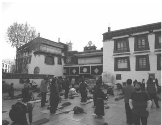
ジョカン寺の前で五体投地をする人々（ラサ）